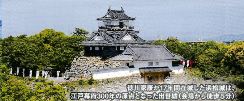
徳川家康が17年間在城した浜松城は、江戸幕府300年の原点となった出世城(会場から徒歩5分)