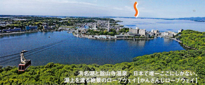
浜名湖と館山寺温泉 日本で唯一ここにしかない湖上を渡る絶景のロープウェイ【かんさんじロープウェイ】